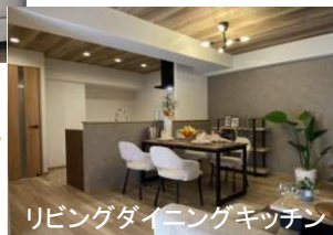
リビングダイニングキッチン