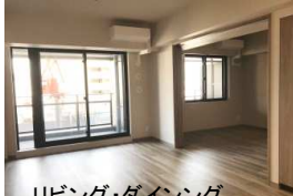
リビング・ダイニング