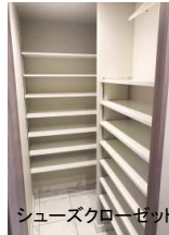
シューズクローゼット