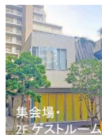
集会場・2F ゲストルーム