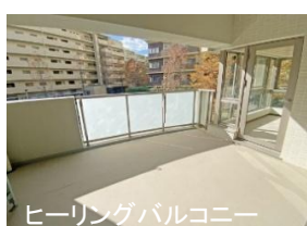
ヒーリングバルコニー