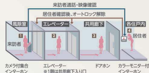
カメラ付集合 インターホン エレベーター ※1階は共用廊下入り口 ドアホン カラーモニター付 インターホン

住戸内のインターホンで来訪者を確認してから解錠できるのでとても安心。火災や、非常通報ボタン等も装備されています。