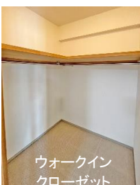
ウォークイン クローゼット