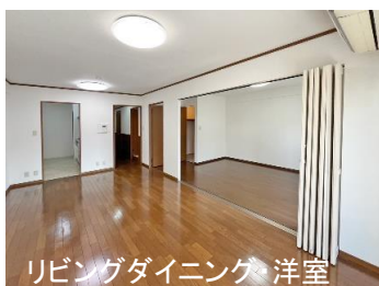
リビングダイニング 洋室